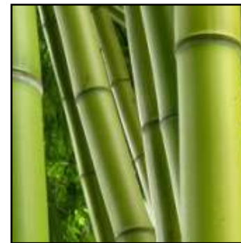
bamboe is mooi!