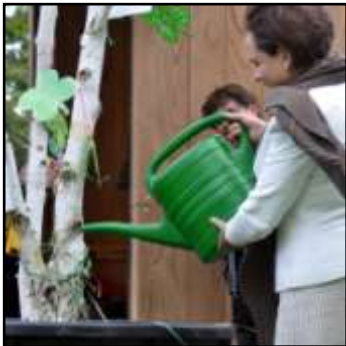
wethouder schenkt berk

In ontwikkeling: herplant niet aangeslagen tulpenboom medio november 2012 | wens via onderzoek Groene Schoolpleinen geleid door de VU, Green Kids en samenwerking met basisschool De Klaver de ontwikkeling van het schoolplein te sturen naar een nieuwe insteek die de sociale duurzaamheid verdiept en ook de fysieke duurzaamheid bevordert.