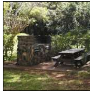
barbecue / picknick plaats