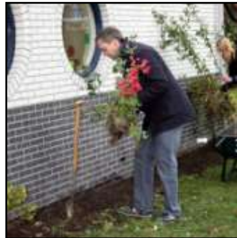
ministerie vws helpt mee