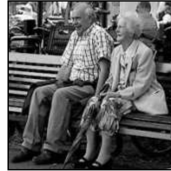
verpozen met koffie nabij