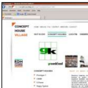
groenkleed op site chv