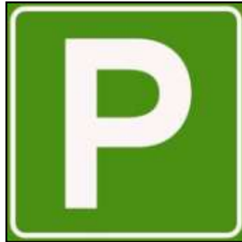
parkeren in het groen