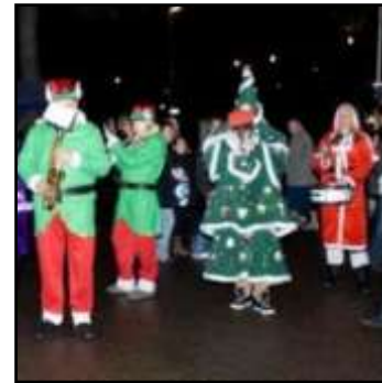
natuurlijke setting kerstmarkt?