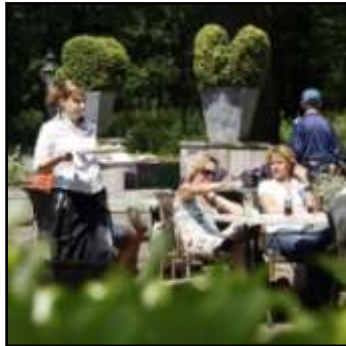
zonnig terras Dokkaffee