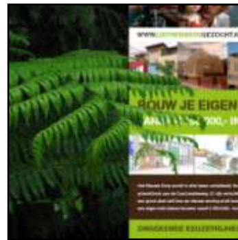
groene etalage wijde blick