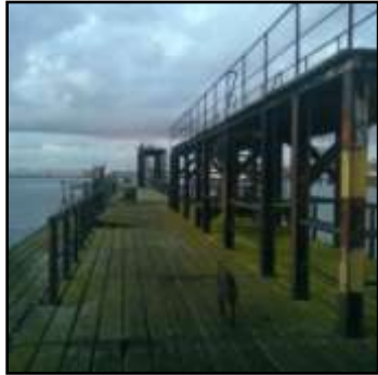
uitdagende plek voor groen