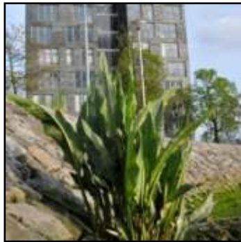
ruimte voor 'natuur'