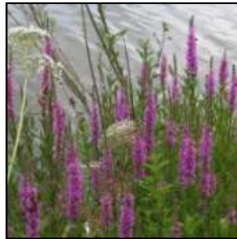
mooie natuurlijke begroeiing