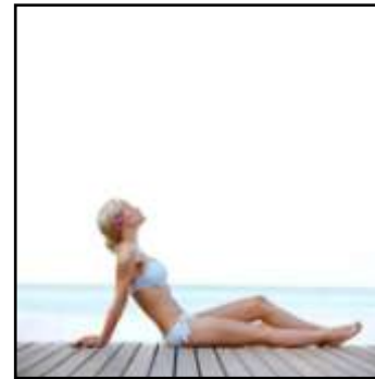
mooi meisje aan de maas