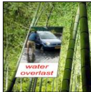
impressie gerichte educatie