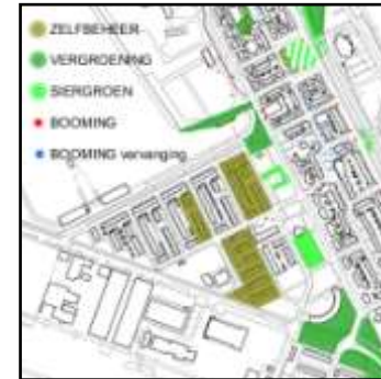
voorstel voor vergroening