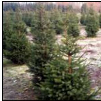
voor iedere boom 2 nieuwe