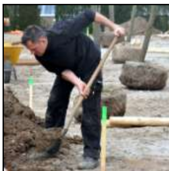
1 ste aanplant 38 bomen