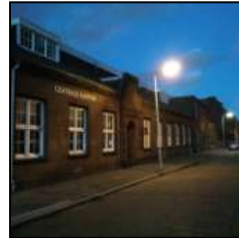
rdm / heijplaatstraat