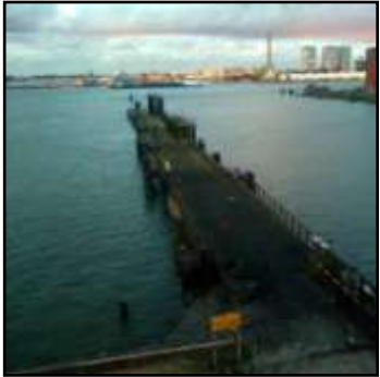
oude pier in de dokhaven