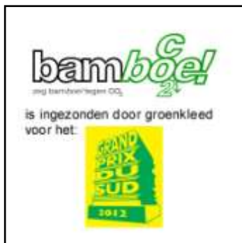
inzending grand prix du sud