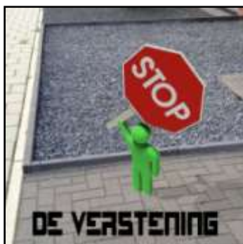
roep verstening een halt toe!