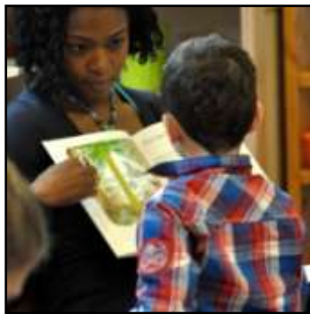
dag van de duurzaamheid