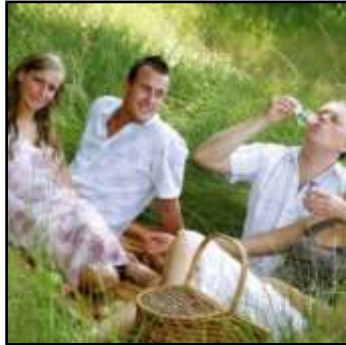
verpozen op het kleed